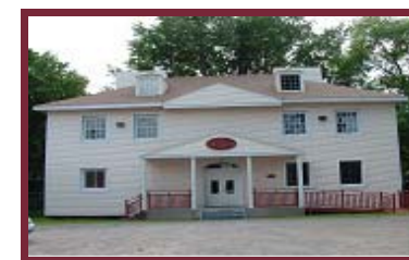
La Villa en 2007

1185 Avenue La Sarre Vieux-Limoilou, Québec, Canada www.ccjgd.ca Tél.: 529-2825 Fax: 529-3528