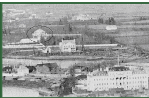
La Villa Ringfield vue de la Haute-Ville, vers 1875