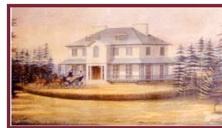
La Villa au 19 e siècle