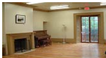
La Salle Parke après rénovation